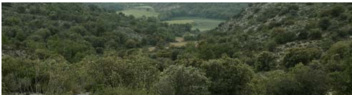
Vegetació protegida de la guixera