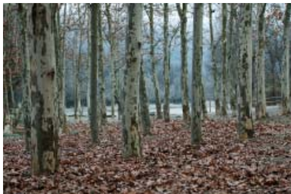
Bosc de ribera a la tardor