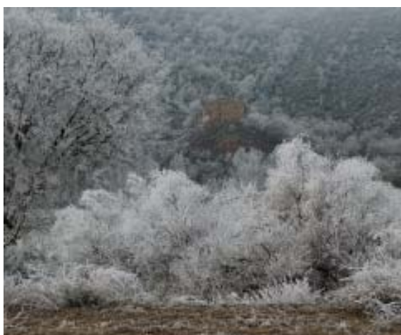
Paisatge gebrat al Llobregós