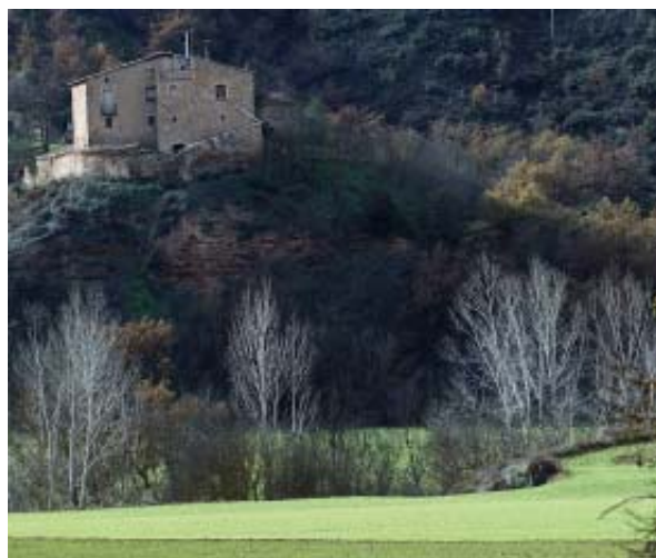
Les masies formen part de l'hàbitat i de la vida d'aquest territori, suara protegit