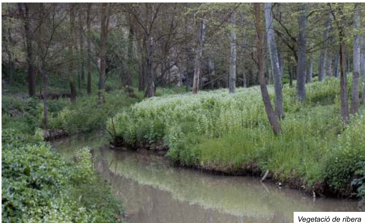
Vegetació de ribera