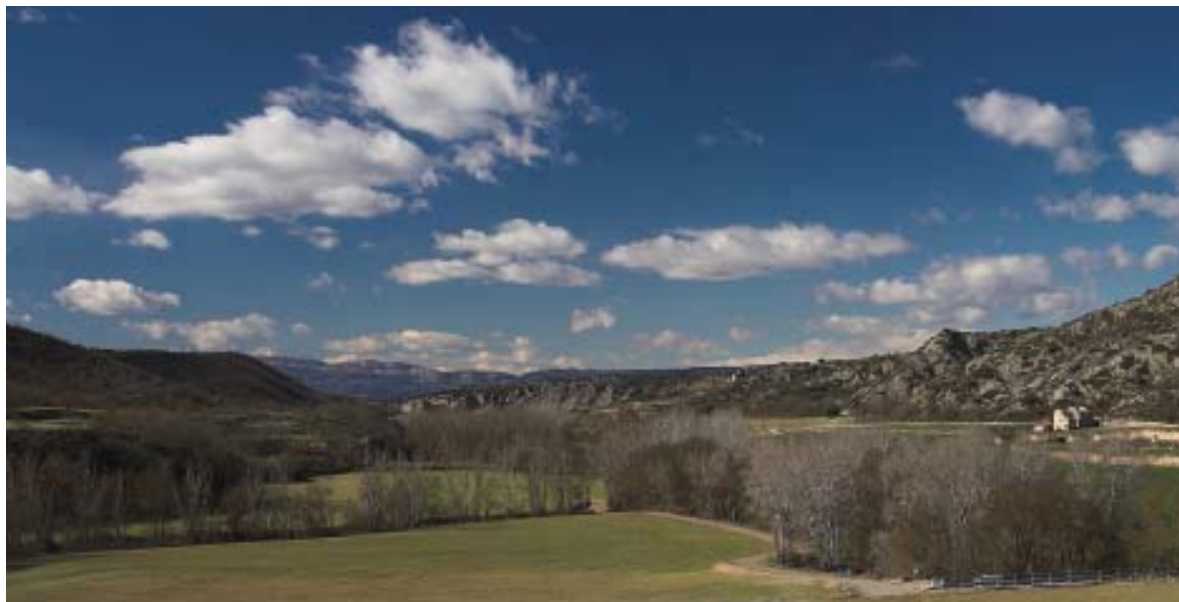
Vista des del pont de la Codina

Així doncs, tot i que als més profans ens cal una observació més meticulosa per captar tota la seva diversitat i bellesa, la singularitat d'aquest territori i del seu poblament vegetal és científicament indiscutible.