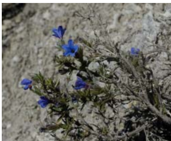
Vegetació característica de les guixeres