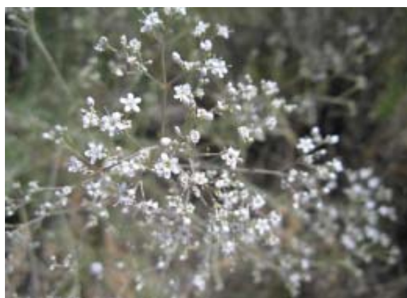
Gypsophila struthium hispanica