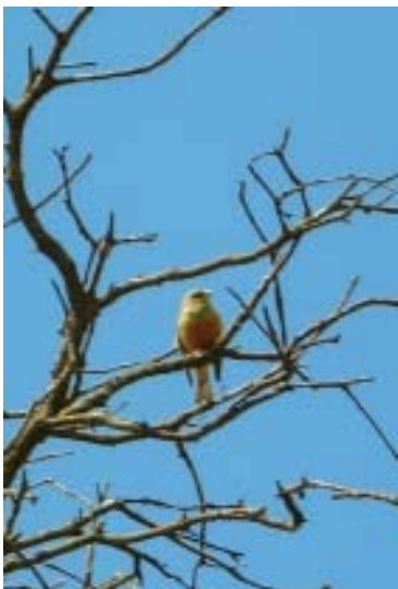
Oriol ( Oriolus oriolus )