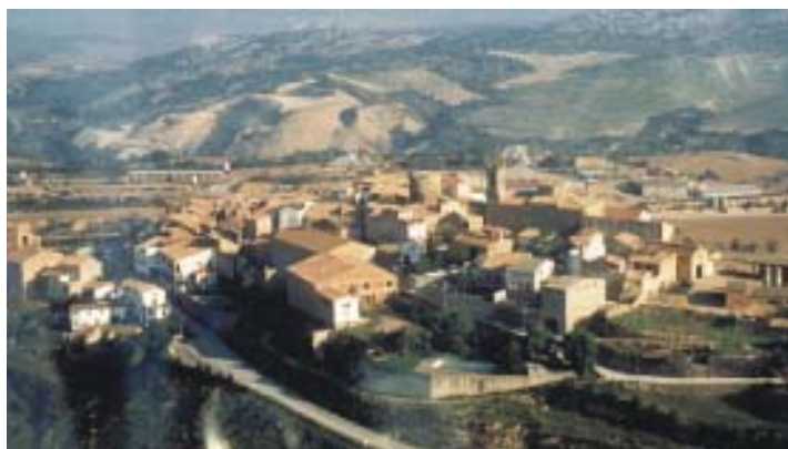
El nucli d'Ivorra amb la torre de guaita al mig